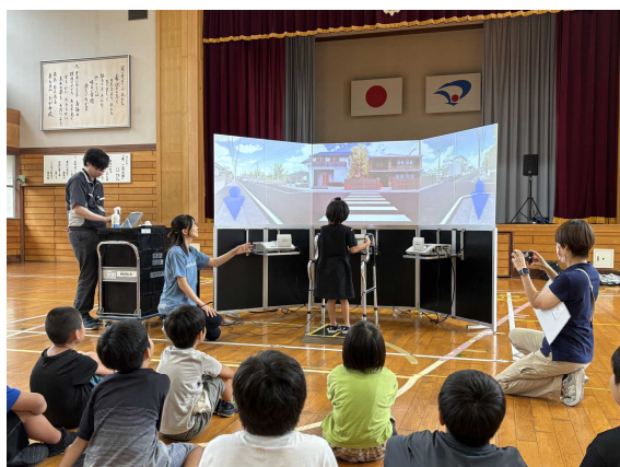
「わたりジョーズ君」を体験する児童

大仙市の小学校2校において、児童が道路を横断する場合の安全確認の方法を模擬体験するため、横手精工株式会社に依頼し、歩行環境シミュレータ「わたりジョーズ君」を活用した交通安全教室を開催しました。