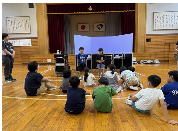
体験した児童の感想発表